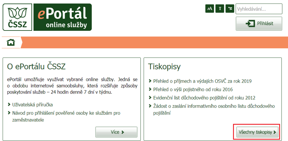
Obrázek 5: ePortál – TISKOPISY