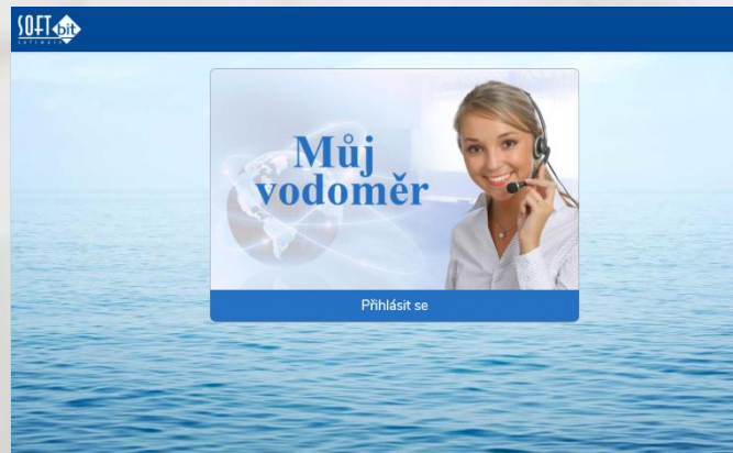
Aplikace Můj vodoměr